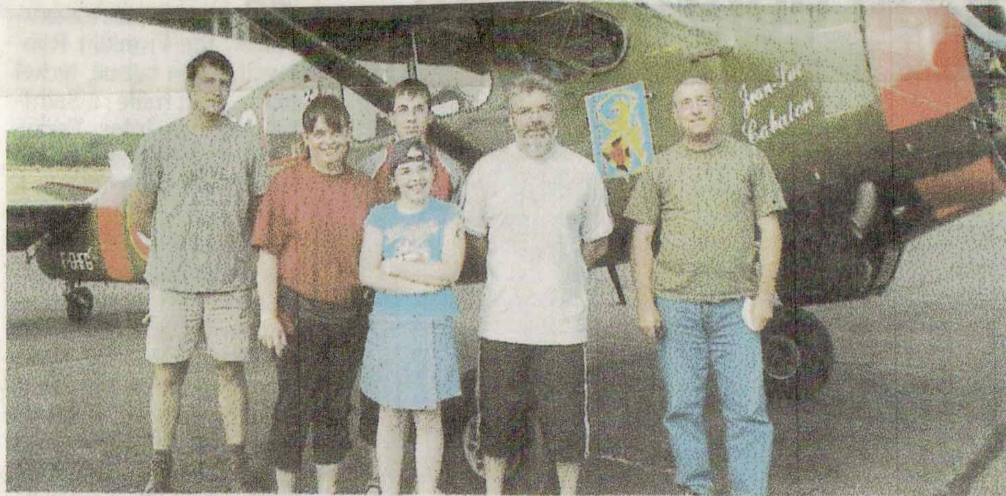
Le Broussard toujours vedette incontestée du club

L'aérodrome de Pouilloux a connu une intense activité à l'occasion de la traditionnelle porte ouverte. Les éléments furent favorables et les nuages juste là pour faire joli.