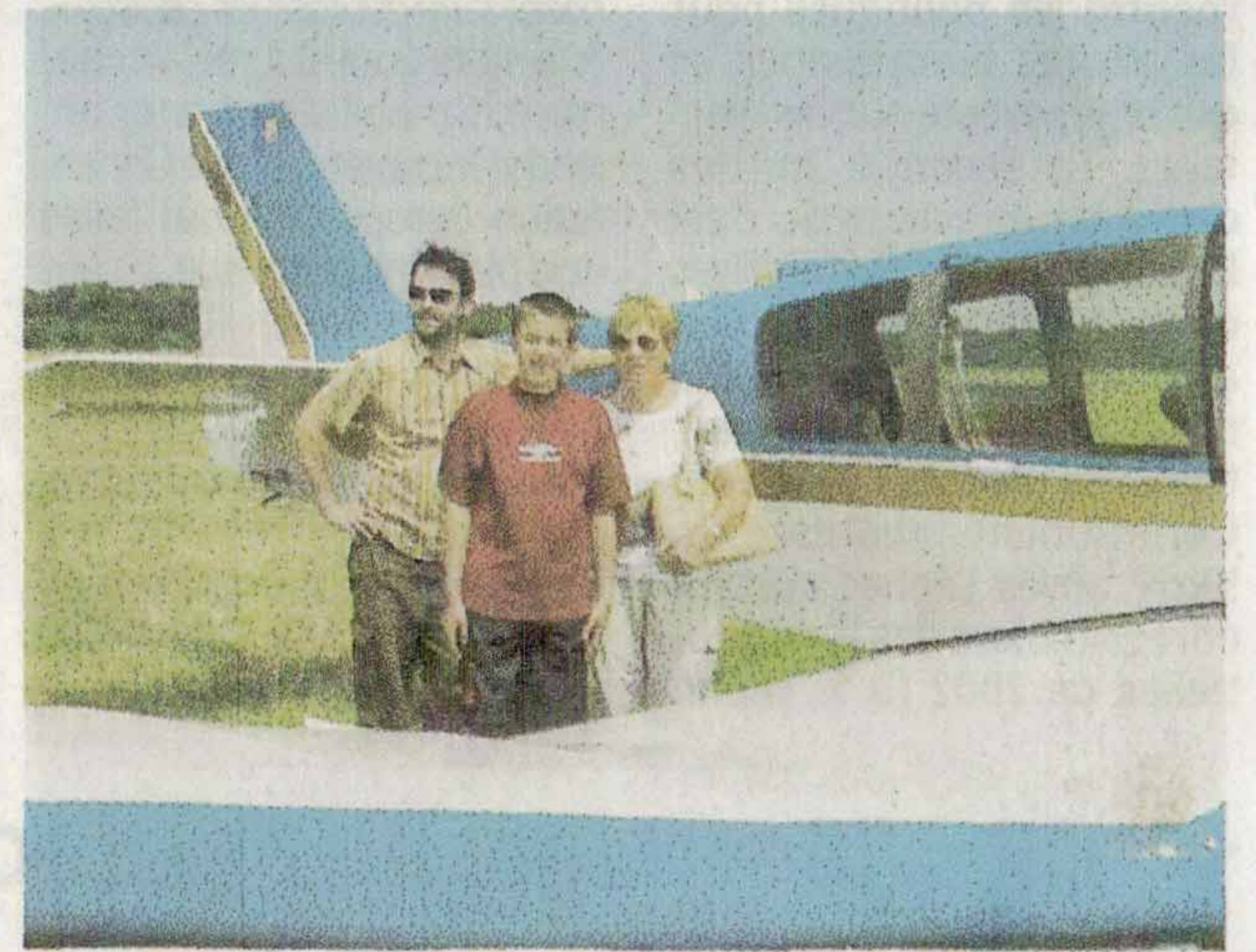
Une expérience inoubliable, le premier vol

Tout au long de l'après-midi et jusque tard dans la soirée, cinq avions ont embarqué tour à tour des passagers pour aller voir les nuages de